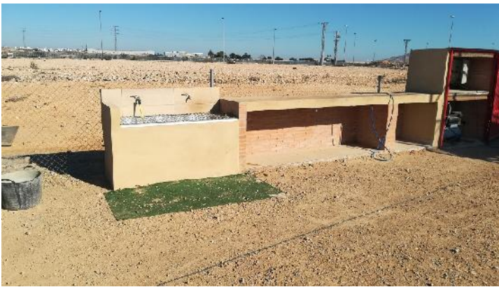
ZONA DE SOPLADO Y LAVADO.