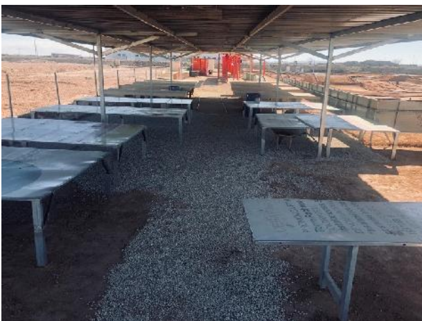
BOXES CON SU TECHADO PARA SOMBRAJE.