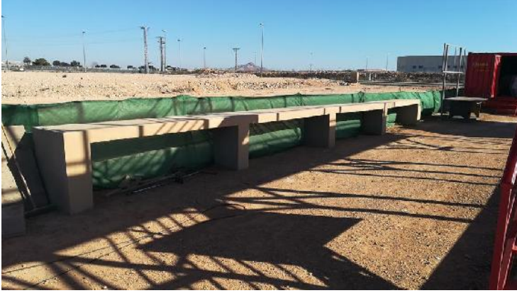
ZONA DE PRECALENTAMIENTO.